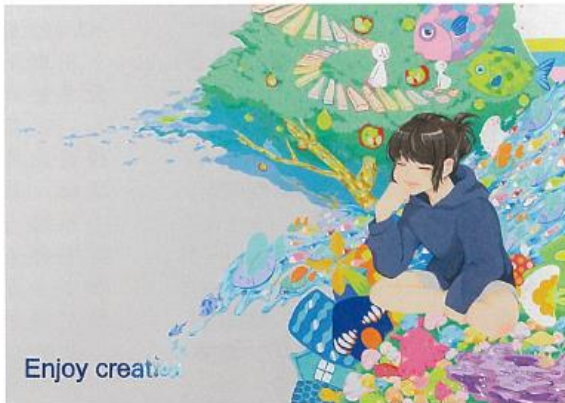
Enjoy creation 西村采音