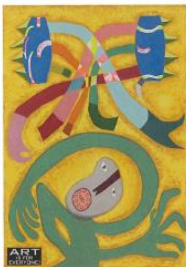
Art is for every one! 丸井恵美