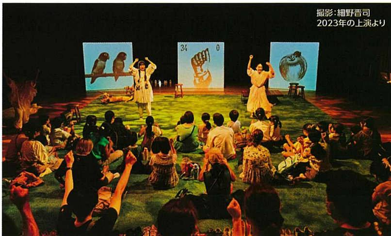
2023年の上演より