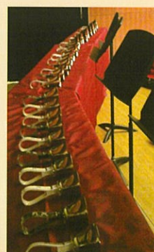
多彩な奏法と様々な音響効果にチャレンジ！