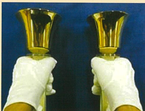
ベルがサビないように手袋を着用し、ハンドルをしっかりとって胸前でまっすぐに打ちます。